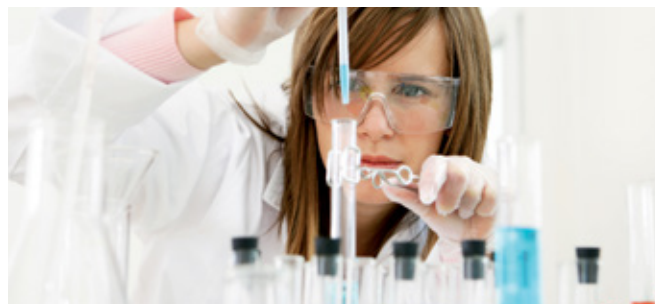
Now and then – Research and development make up a vital part of our company's core competence.